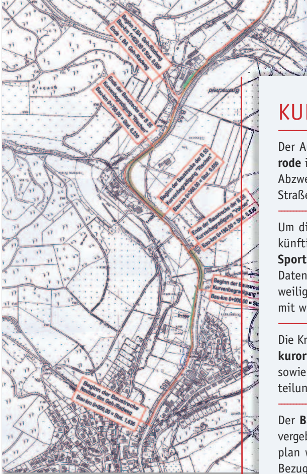
Oben: Ausbau-Planung des ersten Teilabschnitts des Radweges Eslohe-Cobbenrode